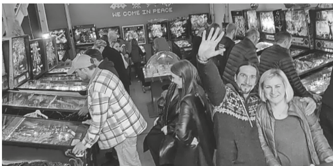
Viel Spaß hatten die Besucher und Besucherinnen beim letzten offenen Flippermuseumsabend.