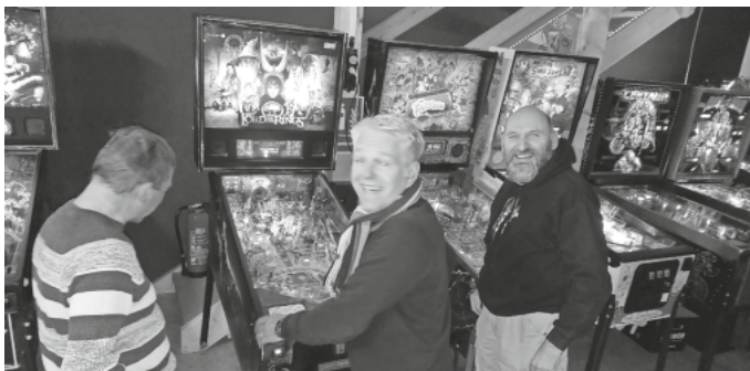
Einige der Gründungsmitglieder beim ersten Spiel nach der Reparatur

Infos und Anmeldung unter Flippermuseum.org oder flippermuseum@gmx.de